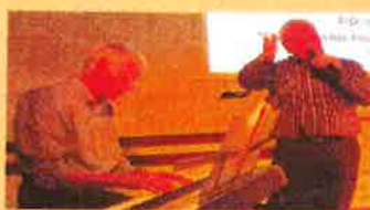
Régie : Etienne ADLOFF

Avec l'aimable participation de Jean-Marie FRIEDRICH & Emile NARTZ qui présentent leurs dernières chansons, de même que les célèbres Wetzvezähler Raymond & Richard NEFF qui passent régulièrement sur Dreyeckland