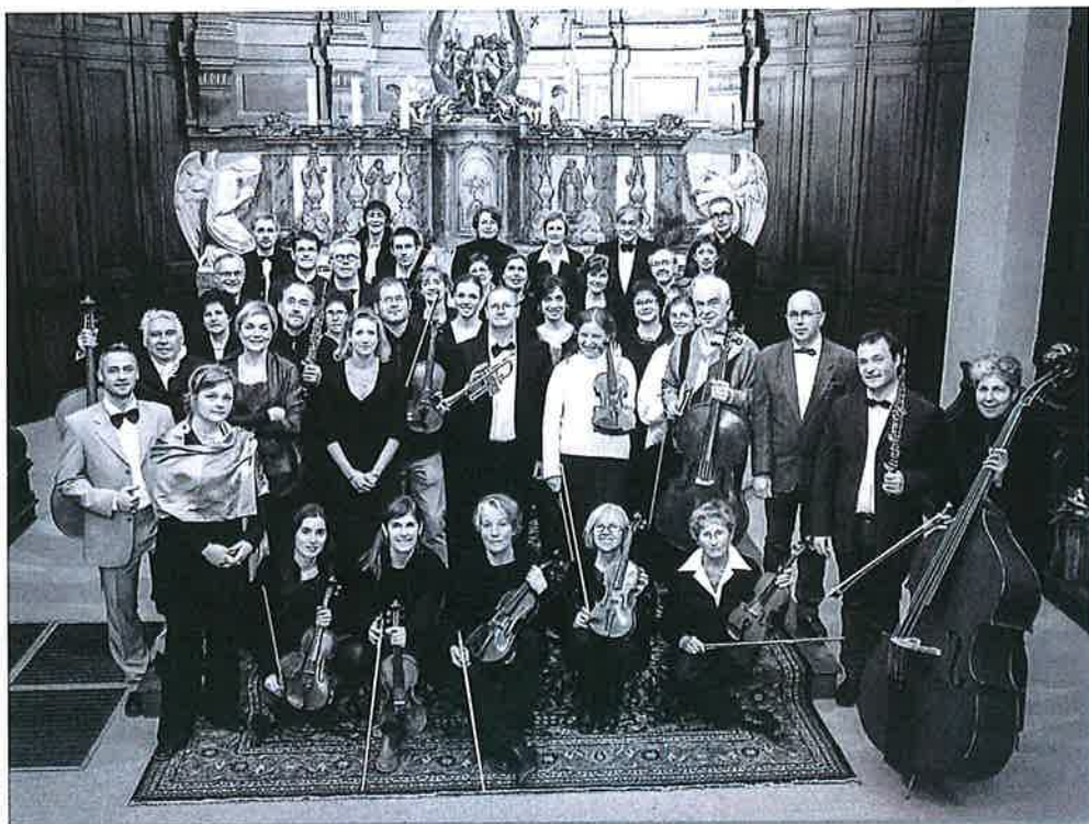
Ensemble vocal et orchestral, CAPELLA SACRA

Dimanche 25 janvier 2015, 17h Dambach-la-Ville Église St-Étienne